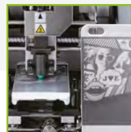
Grábela sobre el material que desee