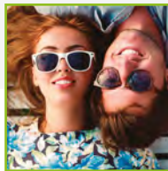
Seleccione su imagen

La MPX-95 funciona tan fácilmente como una impresora de sobremesa, permitiendo que los usuarios con niveles de experiencia de todo tipo consigan unos llamativos resultados de alta calidad. Simplemente importe el texto o las imágenes, diseñe y edite los gráficos y grábelo todo marcando su propio estilo. El software Roland METAZAStudio, incluido con la MPX- 95, permite empezar a grabar tras instalarla, sin demoras.