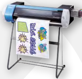
Soporte opcional PNS-24